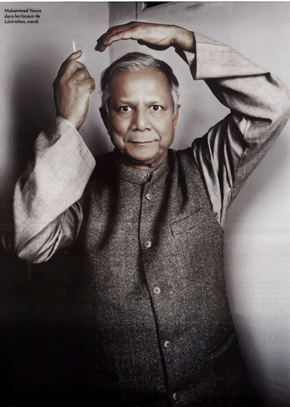
Muhammad Yunus dans les locaux de Libération, mardi.

... réconcilier, même si le business que je défends n'a pas pour objectif de produire du revenu. Quand je parle aux Américains, ils ne comprennent pas : comment pouvez-vous faire quelque chose qui ne génère pas de l'argent ? Mais si on enseigne aux enfants qu'il y a deux formes d'entreprises - l'une est le business social, l'autre fait de l'argent -, ils vont comprendre les choses et, en grandissant, ils peuvent avoir envie de s'investir. J'investis, je crée de l'entrepreneuriat social pour créer des emplois. Et je veux seulement récupérer ma mise.